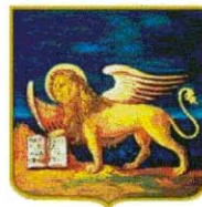
Regione del Veneto

SEGRETERIA ORGANIZZATIVA c/o Studio RX Via Fermi, 1 · CP 70 36063 Marostica/VI tel. 0424.72799 fax 0424.470288 www.mezzadelbrenta.it