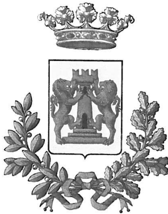
Comune di Bassano del Grappa (VI)

Analisi della congruità economica del costo del servizio per la gestione dei rifiuti urbani nel Comune di Bassano del Grappa a supporto della relazione di cui all'art. 34 comma 20 del DL 18 ottobre 2012, n. 179 (convertito con Legge 17 dicembre 2012, n. 221)